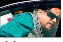
हरिभूमि न्यूज ►► मलपुरम