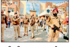
हरिभूमि न्यूज ►► चंडीगढ़

पंजाब के चंडीगढ़ सेक्टर-37 स्थित भाजपा मुख्यालय में हुए ब्लास्ट केस को पुलिस ने सुलझा लिया है। पंजाब पुलिस की काउंटर इंटेल्जेंस शाखा ने चंडीगढ़ पुलिस के साथ संयुक्त अभियान में इस घटना में शामिल पांच लोगों को गिरफ्तार कर लिया है। हमले में शामिल दो मुख्य हमलावरों की पहचान कर ली गई है। इनके कब्जे से एक हैंड ग्रेनेड, .30 बोर जिगाना पिस्टल और जिंदा कारतूस बरामद किए गए हैं।