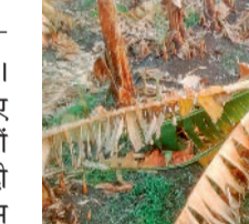
यहां भी दिखेगा मौसम का असर

मौसम का मिजाज पूरी तरह बदल गया है। देश के एक बड़े हिस्से में अचानक आए इस बदलाव ने लोगों की मुश्किलें बढ़ा दी हैं। भारतीय मौसम विज्ञान विभाग (आईएमडी) ने देश के कई राज्यों के लिए 'अर्जेंट अलर्ट' जारी किया है। मौसम विभाग के मुताबिक, अगले 24 घंटों में छत्तीसगढ़ समेत कई राज्यों में तेज आंधी-तूफान के साथ भारी ओलावृष्टि और बिजली कड़कने की >>> शेष पेज 6 पर